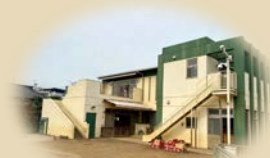
ひばりっこくらぶ保育園

ひばりかんとりーくらぶ 当法人のホールです。一時保育の「ばら組」や学童保育「FUNくらぶ」を行っています。